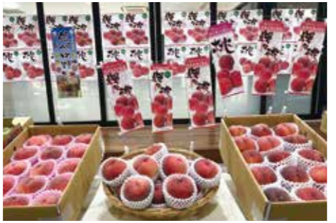
店頭に並べられたもも

今年は陽気良く、前進出荷も見られ「適度な雨により、ロスも少なく市場に出荷できるものが増えている」といい、他産地にも劣らない色づきと味のももを大きくアピールしました。