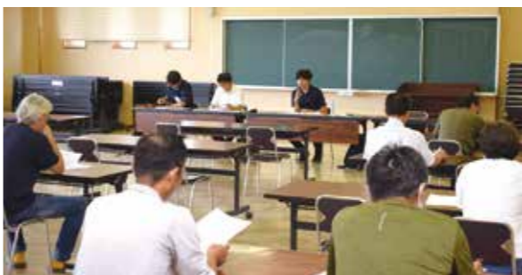
熱心に説明を聞く生産者

当日は、JA営農支援課の担当者から、対象者や品目などの説明および、事業着工のスケジュールや必要書類などの確認がされ、参加した生産者は積極的に質問していました。