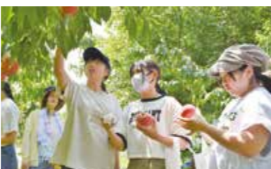
ももの収穫を体験する生徒

当日は、JA担当技術員から中野市産のももの品種や栽培技術について学んだあと、「あかつき」の収穫を体験。袋を外し、慎重にもぎ取りました。収穫後は取れたてのももを試食し「とても甘くて果汁がたっぷり入っていてびっくりした。中野市産のももについて多くのことを学べたので、今後の実習に活かしていきたい」と話していました。