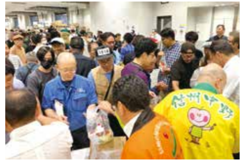
多くの流通関係者であふれたももの配布