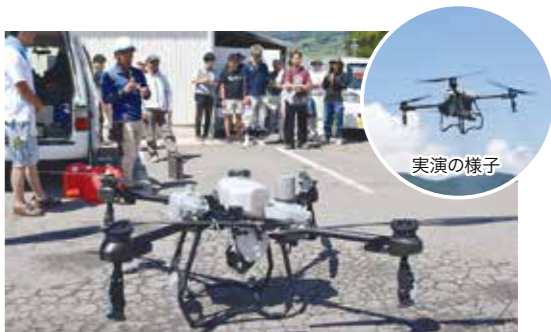
農業散布型のドローン

JAでは、生産者の生産性向上や農作業の負担軽減を目的に、ロボット技術を活用した「スマート農業」の実演会を今後も行っていく予定です。