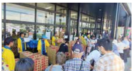
大勢の来場者で賑わったもも祭り

県外からの来場者は「色々食べ比べたがどれもおいしい。地元のお店で買うよりも安く、品質も良い」と話していました。