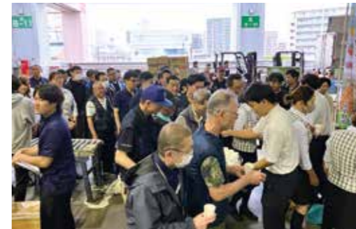
大好評だった浅漬けの試食コーナー

また、当JAで出荷の最盛期を迎えるハウスぶどう「ナガノパープル」「シャインマスカット」「クイーンルージュ®」や、もも・プラムのトップセールスを実施。JA中野市では、園芸ときのこの両輪で生産・販売強化を進め、農産物の高品質生産に継続して取り組むとして、市場関係者にPRしました。