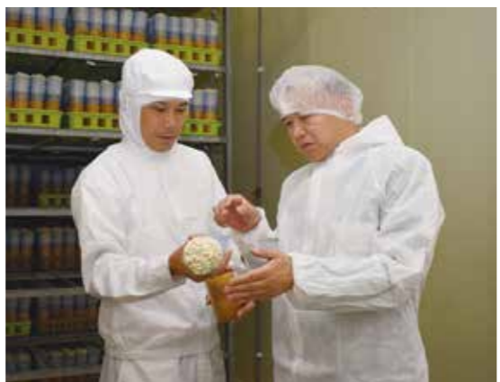
えのき苺の栽培工程を学ぶ二宮社長(右)