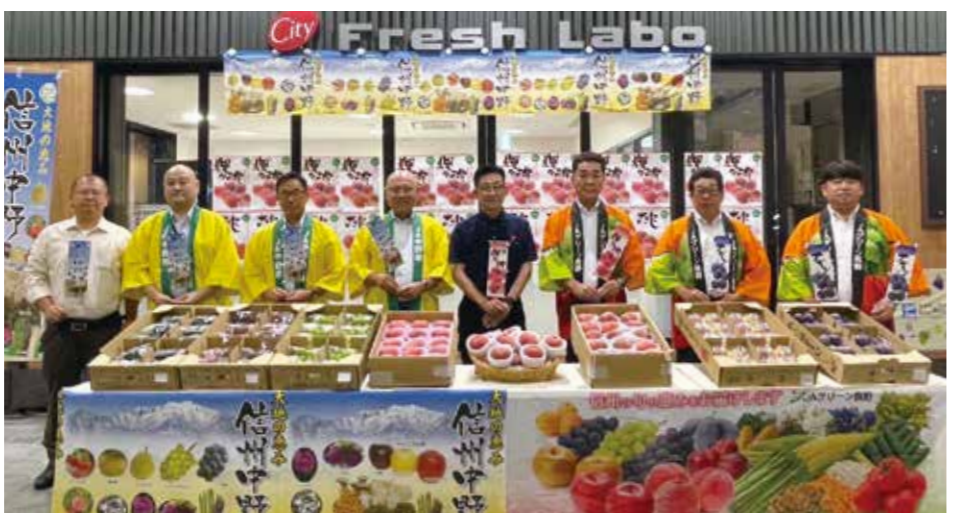
東京シティ青果棟で行われたダブルトップセールス

市場では、長野県の北部に位置する両JA管内は日照時間が長く、昼夜の寒暖差も大きいことから、果実の栽培に適した一大産地と紹介され、もも「あかつき」と「なつっこ」、プラム・ブルー、これから旬を迎える「ナガノパープル」「シャインマスカット」「クイーンルージュ®」といったぶどうを展示。流通関係者に両JAから「あかつき」と「なつっこ」を1個ずつ、2個入り約200セットのももが配られ、取り合いになるほど盛況でした。