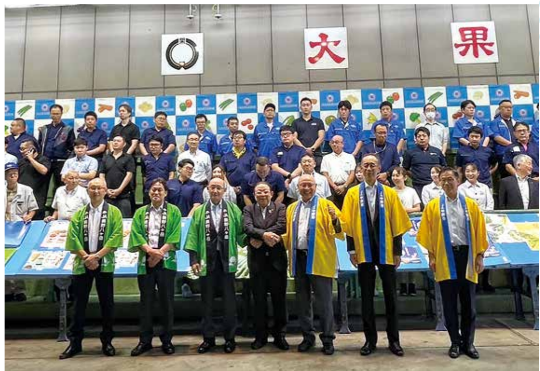
大果大阪青果樹で行われたダブルトップセールス

JA中野市は、今年も管内JAとともにトップセールスを実施しました。今回は、7月のJA長野八ヶ岳、8月のJAグリーン長野とのトップセールスについてご報告します。