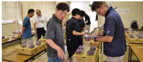
審査にあたる部会役員ら