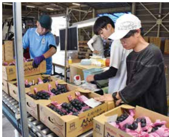
外観や糖度などを検査する選果担当者

JAと同部会では、令和6年度の販売実績75億円の必達に向けて、食味重視の徹底や部会員の技術向上に取り組み、消費者や市場から選ばれる産地を目指していきます。