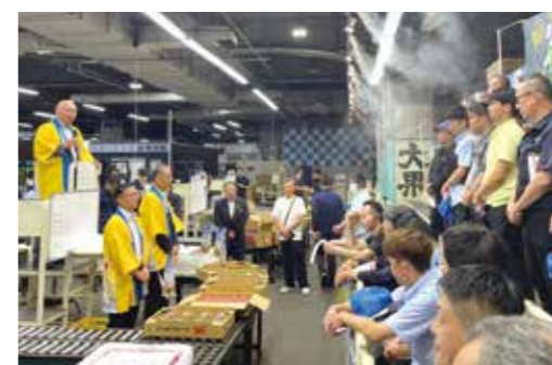
市場関係者に中野市産のもも等をPRする望月組合長