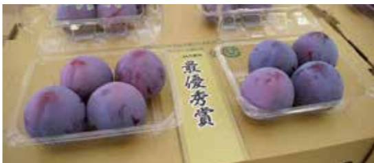
最優秀賞に選ばれたプラム「太陽」