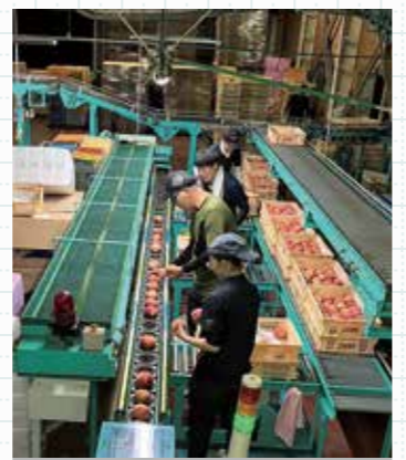
ももの選果作業に汗を流すJA職員ら