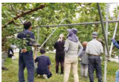
園地の枝を確認する部会員ら

合剤の塗布方法、樹形改造方法を説明。「どの枝にも十分な日光が当たり、容易に防除薬剤がかかるようにすることが大切。諸作業が行いやすく、能率を上げることを念頭におき、剪定作業を進めてください」と呼びかけました。参加した部会員は、園地の枝を確認しながら熱心に受講していました。