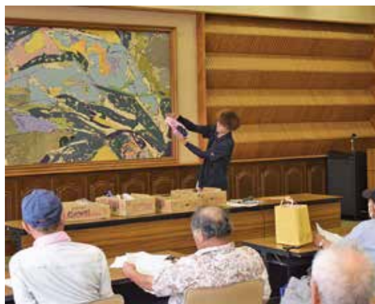
出荷規格を確認する生産者